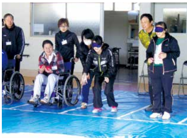
障害に応じたスポーツの工夫 (ボッチャ)