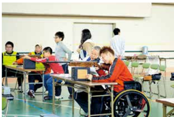
チームライフルの体験