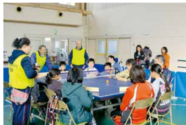
卓球バレーの体験

障害者スポーツを身近に体験することにより、障害者スポーツへの一層の理解と協力を得る機会として、わかくさアリーナ祭が、平成26年11月30日(日)、わかくさアリーナ及びとちぎ福祉プラザ前芝生広場（宇都宮市）で開催されました。