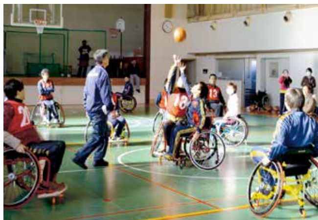
車椅子バスケットボール