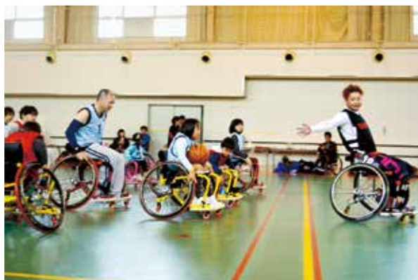
車椅子バスケットボールの体験