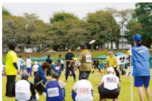
第10回栃木県障害者スポーツ大会の風景