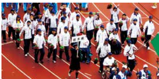
第14回全国障害者スポーツ大会（長崎大会）

【大会期日】 平成27年10月24日(土)～26日(月) ※栃木県選手団の派遣期間は、10月22日(木)～27日(火)の6日間となります。