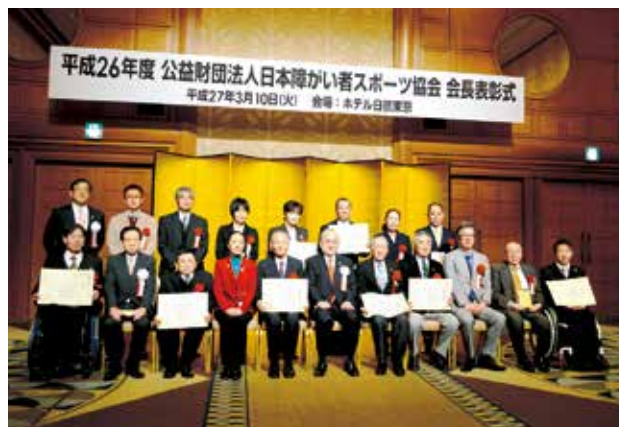
受賞者による集合写真