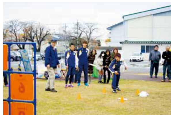
フライングディスクの体験