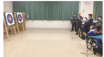
アーチェリーの様子