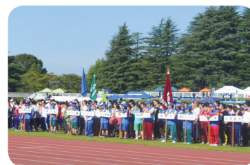
第13回大会 開会式の様子