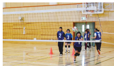
女子バレーの様子