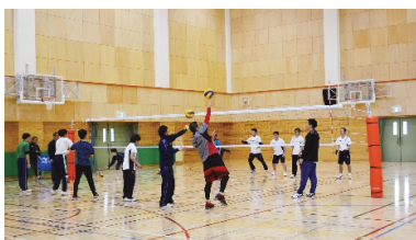
男子バレーの様子

バレーボール(知的障害)のチームを結成すべく全5回の体験会を実施し、男女ともにチームを設立することができ、今年第18回全国障害者スポーツ大会(福井しあわせ元気大会)関東ブロック地区予選会へチームを派遣します。