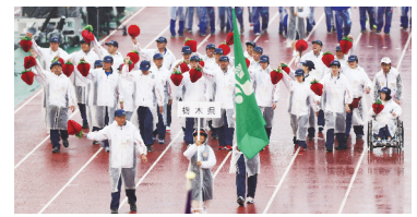
第17回全国障害者スポーツ大会(えひめ大会)