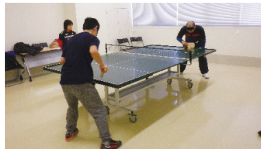
サウンドテーブルテニスの様子