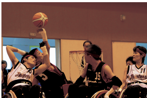
車椅子ツインバスケットボール