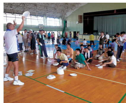
フライングディスクアキュラシー (那須烏山市)