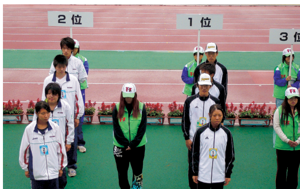
4 x 100mリレー、1位と同タイムの銀メダル