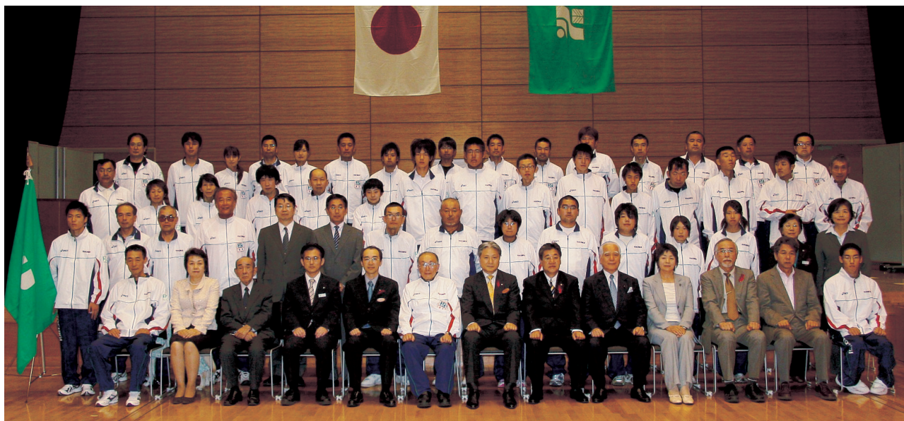
結団式。福田富一知事から「いつまでも心に残る大会になるよう最善を尽くすとともに、全国の選手と友情の輪を広げてきてください。」と激励の言葉が送られた。