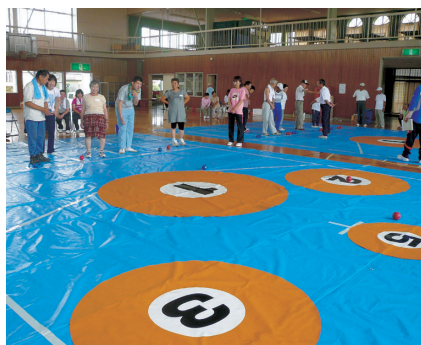
コントロールアタック(那珂川町)