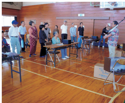
ビームライフル(栃木市)