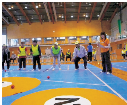
コントロールアタック(佐野市)

身近な地域でスポーツに楽しむことができる環境作りを推進するため、今年度も多くの市町と共催で障害者スポーツ教室を開催しました。