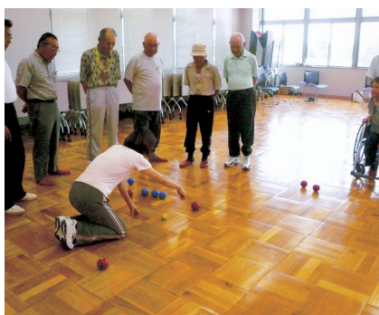
ソフトペタンク(西方町)