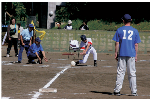
グラウンドソフトボール