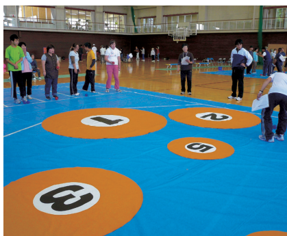
コントロールアタック(日光市)