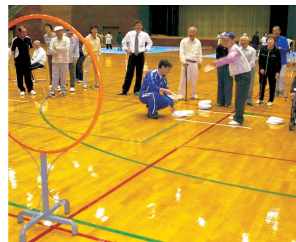
フライングディスクアキュラシー (真岡市)