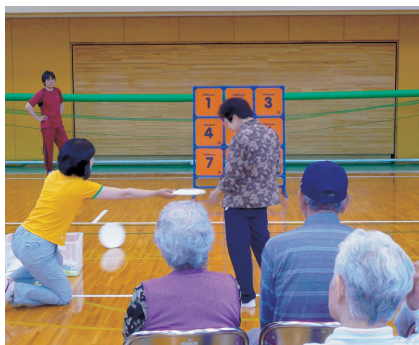
フライングディスクストラックアウト (那須塩原市塩原)