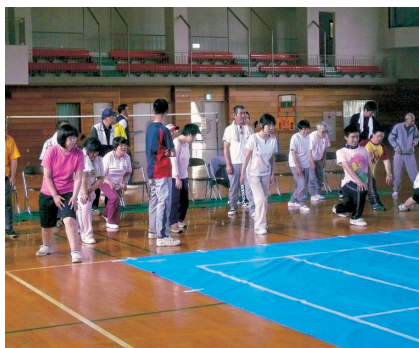
コントロールアタック(益子町)