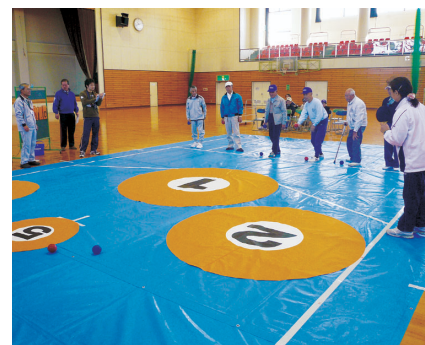
コントロールアタック(栃木市藤岡)